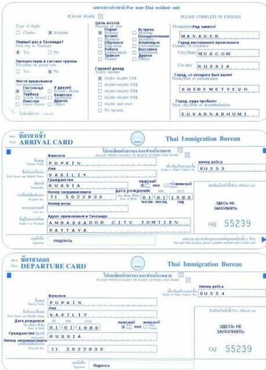
Рис. 1 Образец и пример заполнения иммиграционной карты

После прохождения паспортного контроля не забудьте забрать багаж.